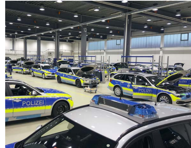
Bei Bertrandt in München werden die Fahrzeuge für den Einsatz vorbereitet.