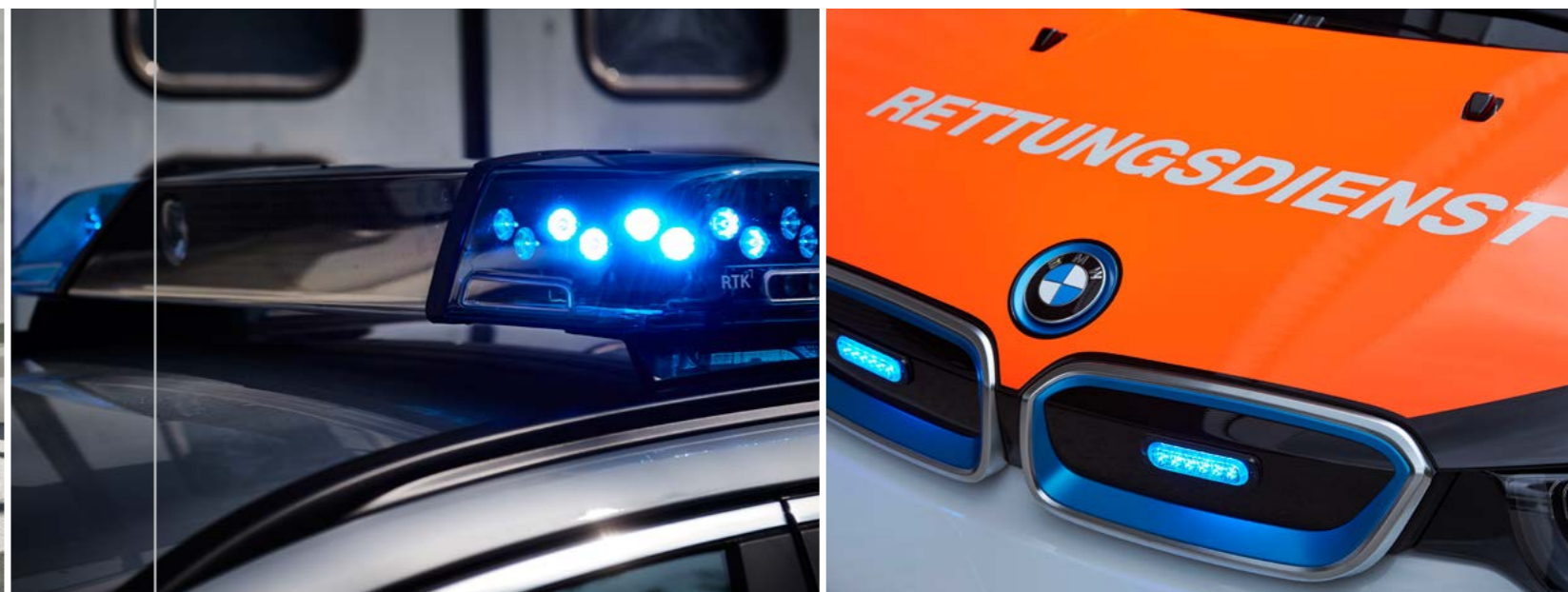
Spezielle Ausrüstungen und Features der Einsatzfahrzeuge.

Bertrandt fungiert für alle Werks- und Nachrüstlösungen als Generalentwickler der BMW-Einsatzfahrzeuge. Der Umfang umfasst alle Modelle und Derivate – vom Mini bis zum BMW 7er. Sowohl die Konstruktion als auch die Integration aller spezifischen Komponenten sind davon betroffen. Von Vorteil erweist sich das gute Bertrandt-Netzwerk hinsichtlich Absicherung, Shaker, Salzsprühstest, Berechnung und VR.