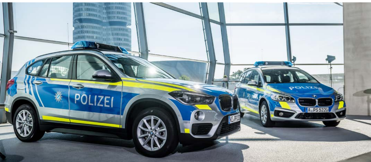
Bestens für die Herausforderungen im Dienst gerüstet.

Bereits vor mehr als 15 Jahren wurde Bertrandt mit der Entwicklung von Einsatzfahrzeugen auf Basis von BMW 3er Limousine und Touring beauftragt. Erstmals wurde durch BMW die konstruktive Integration der behördenspezifischen Einbauten inklusive der Elektrik-/Elektronikumfänge vergeben. Nach erfolgreichem Serienstart dieser Fahrzeuge erhielt Bertrandt den Auftrag, weitere Behördenumfänge zu entwickeln sowie behördenspezifische Komponenten an BMW zu liefern. Zugleich folgten weitere Aufträge, um Behördenfahrzeuge zu fertigen. Seit diesem Zeitpunkt wurde das Leistungsspektrum permanent ausgebaut, so dass es heute neben den Entwicklungsumfängen auch die Serien- und Einzelfertigung von Einsatzfahrzeugen sowie die Serienlieferung behördenspezifischer Komponenten umfasst.