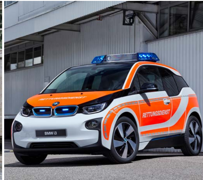
Einsatzfahrzeuge gibt es in unterschiedlichen Modellen - jeweils spezifisch angepasst.