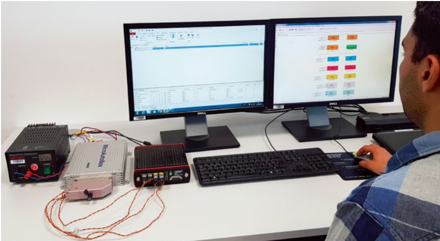
BILD 4 Laborarbeitsplatz mit MABX2-Hardware und Entwicklungs-Laptop

MABX2 gesendet. In dem in BILD 4 dargestellten Laboraufbau kann das bestehende Modell schnell um neue Funktionen erweitert und bereits implementierte Funktionen getestet und abgesichert werden.