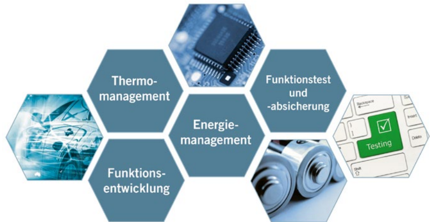
BILD 1 Energiemanagement und Thermomanagement sind zunächst unabhängige Komponenten, die über definierte Schnittstellen eng zusammenarbeiten; beide Komponenten starten mit der Funktionsentwicklung, und am Ende erfolgt die Funktionsverifikation mittels Test und Absicherung

Ein intelligentes Energiemanagement ist erforderlich, um alle Vorgaben zu erfüllen und den Fahrer dabei während seiner Fahraufgabe zu unterstützen [1, 2]. Im Förderprojekt entwickelt Bertrand Energiemanagementfunktionen für das dabei aufgebaute batterieelektrische Demonstrationsfahrzeug. Diese fokussieren sich auf die Hochvoltseite. Dabei wird die Kommunikation aller Teilsysteme des Fahrzeug-Datenbusses und der verbauten Zusatzkomponenten überwacht und analysiert.