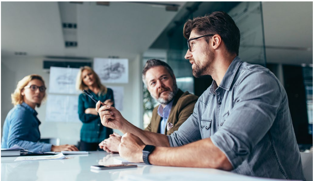
BILD 2 Erarbeitung eines Lastenhefts, in das jeder Projektpartner seine Anforderungen einbringen konnte

Zu Projektbeginn stand die Erarbeitung eines Lastenhefts an, in das jeder Projektpartner seine Anforderungen einbringen konnte, BILD 2 . Im Entwicklungsprozess der Funktionen verfolgt Bertrand einen modellbasierten Ansatz. Das Modell wird in die zwei Haupt-